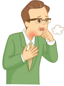
のどの痛みを伴うせきやたんが辛い人に。

ベンザブロックせき止め錠は、 ①鎮咳去たん成分でせきやたんを抑え、さらに ②トラネキサム酸でのどの炎症を抑えることで、 のどの痛みを伴うせき・たんによく効きます。