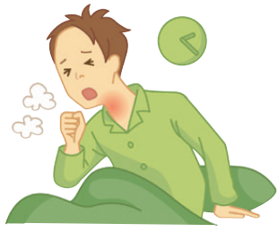
せきが続いて寝つけない人などに、苦味や甘味を気にせず服用できる。